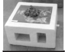
फोहोरं दयेकूगु ज्वलं