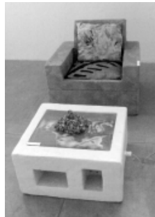
फोहोरपाखें थम्हं हे दयेकूगु ज्वललिसें राजु खड्का व मेमेगु ज्वलं।

यानादीगु ख:। च्यादं तक यानादीगु अध्ययनया लिधंसायु फिला विका: वयुकलं थ्व ज्वलं तयार यानागु खँ कनादीगु दु। थज्या:गु ज्यायु वयुक:या छेंज:पाखें नं त:धंगु तिब: प्राप्त जगु दु। भविष्ययु वना: अज्या:गु हे ज्या लगे मजगु वस्तु छयला: छया छें हे दनेगु वयुक:या रवसा: दु।